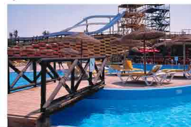
▲ Parque acuático Mario Park, Roquetas de Mar