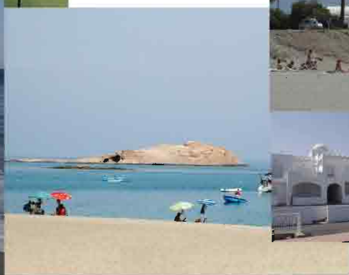
▲ Isla de San Andrés