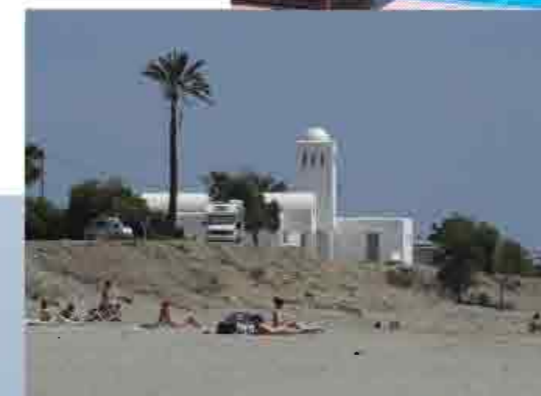
▲ Playas de Mojácar