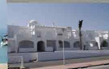
▲ Urbanización Típica del Levante