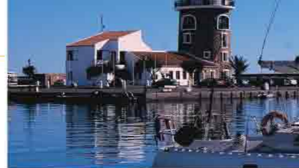
▲ Puerto deportivo de Almerimar, El Ejido

Bandera Azul , en concreto son las de Balerna, Levante-Almerimar, San Miguel-Poniente situadas en El Ejido , las que pertenecen al término municipal de Adra como la de Poniente, Censo y San Nicolás-Levante y las de Roquetas de Mar , Aguadulce, La Romanilla, Playa Serena, La Bajadilla y la de Urbanización Roquetas. En ellas podrá refrescarse y en los puertos deportivos de Almerimar, Adra, Aguadulce o Roquetas