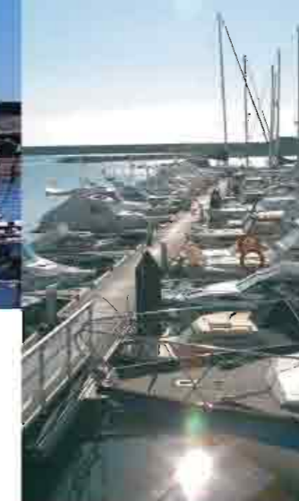
▲ Puerto deportivo de Adra