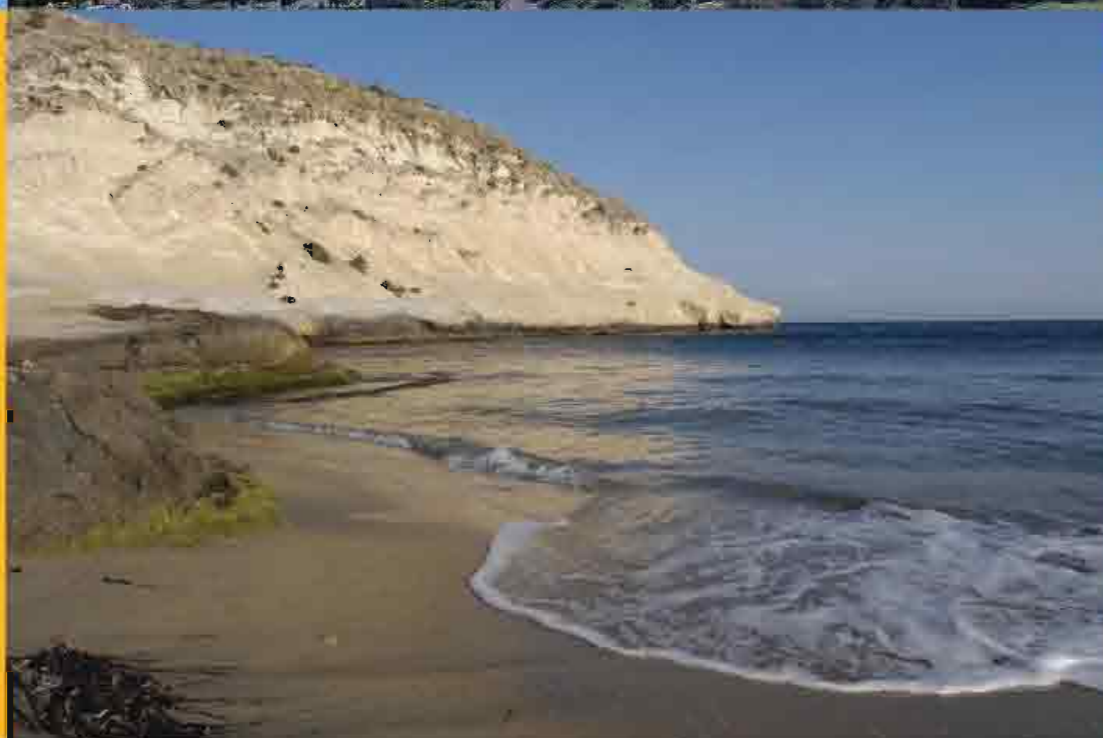
▲ Playa de Terrenos, Pulpi

Si le apasiona el windsurf tiene varias citas, una en la Ensenada de San Miguel en El Ejido y otra en Playa Serena de Roquetas de Mar. También las opciones son varias si desea practicar el golf, incluso le costará decidir en cuál de los tres campos hacerlo.