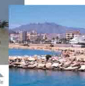
▲ Playa de Garrucha