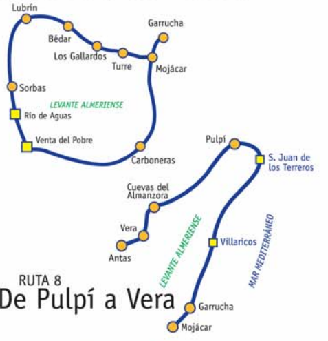
RUTA 8 De Pulpí a Vera