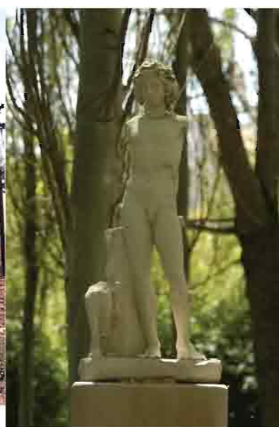
Estatua romana de Dionisio, Chirivel

-El mausoleo El Daymun en El Ejido, una construcción funeraria con planta de cruz griega y arcos en los que se albergaban los sarcófagos, da muestra del asentamiento de la comunidad romana en Almería. Data de los últimos años del asentamiento.