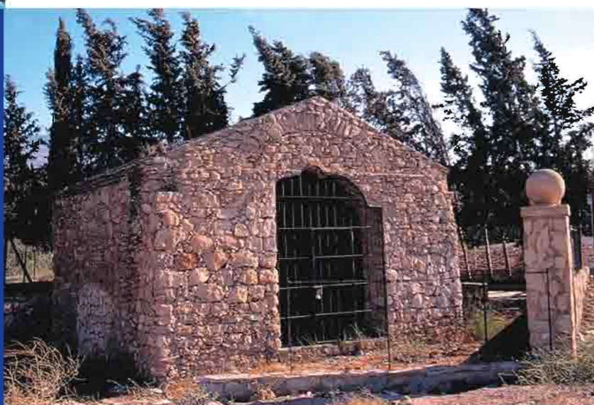
Mausoleo de El Daymun, El Ejido

Una historia milenaria que conocerá durante su visita y que empieza en las pinturas rupestres de Los Vélez, pasando por Santa Fe de Mondújar con el yacimiento de Los Millares o el legado ibero de El Cerro en Dalías.