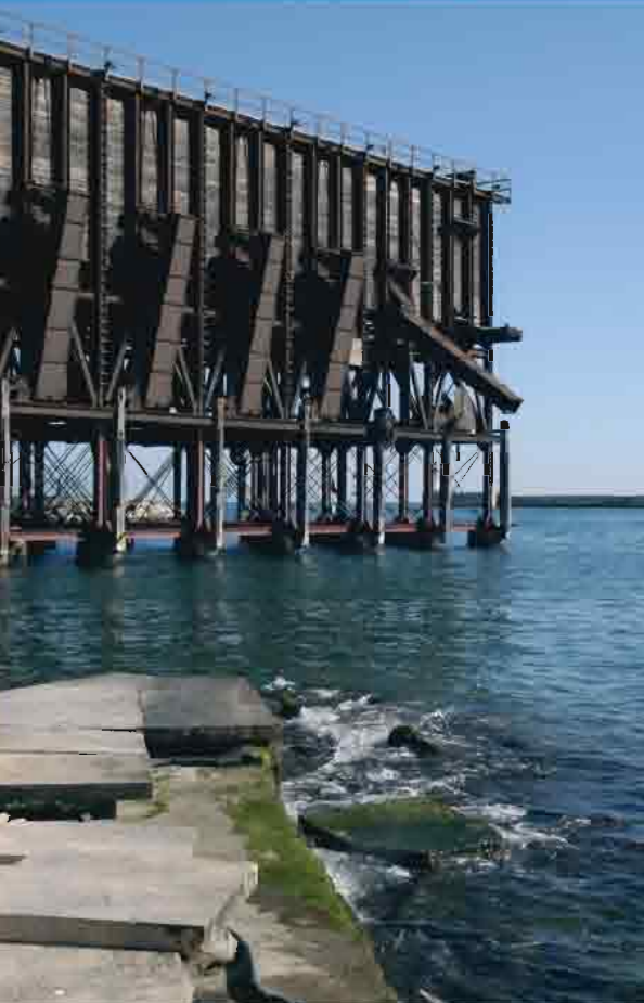
Antigua explotación minera de Rodalquilar