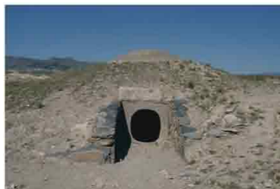
Yacimiento arqueológico de los Millares

Multitud de civilizaciones han pasado por estas tierras y muchos las han deseado sin lograr poseerlas. Ahí comienza la primera página del libro de la historia de Almería, la huella del paso de numerosos pueblos que dejaron parte de sí en este rincón situado al sur de Europa y así lo demuestra el rico patrimonio que se extiende a lo largo de toda la provincia. En Cuevas del Almanzora, en concreto en la Cueva de la Zájara I y II, se tiene constancia de la presencia del hombre durante la Prehistoria y en las cuevas de Sierra María, tiempos después, de manifestaciones de arte en las pinturas rupestres que la UNESCO ha declarado Patrimonio de la Humanidad como las que se encuentran en la Cueva de Los Letreros de Vélez Blanco. Más tarde llegó a Santa Fe de Mondújar, la conocida como civilización de Los Millares, que supuso el empleo, por primera vez, del cobre en el Mediterráneo Occidental y con posterioridad, la civilización protagonista fue la de El Argar en Antas en el Levante almeriense donde habitó la población que alcanzó gran desarrollo en el sudeste peninsular durante la Edad del Bronce.