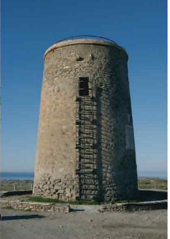
Batería costera de San Felipe de los Escullos