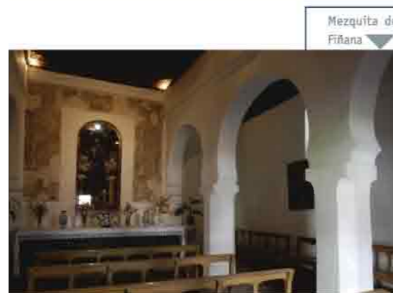
Mezquita de Fiñana

-El mausoleo El Daymun en El Ejido, una construcción funeraria con planta de cruz griega y arcos en los que se albergaban los sarcófagos, da muestra del asentamiento de la comunidad romana en Almería. Data de los últimos años del asentamiento.