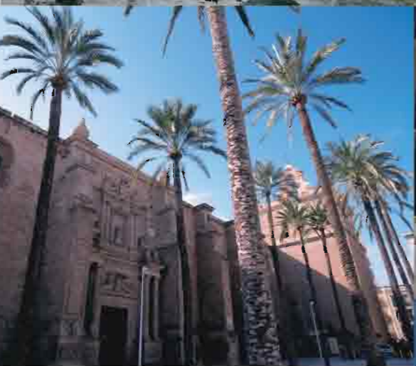
Catedral de Almería