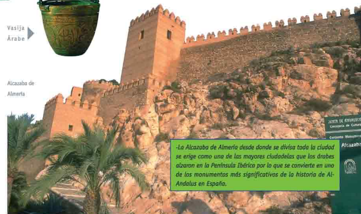
Alcazaba de Almería

-La Alcazaba de Almería desde donde se divisa toda la ciudad se erige como una de las mayores ciudadelas que los árabes alzaron en la Península Ibérica por lo que se convierte en uno de los monumentos más significativos de la historia de Andalucía en España.