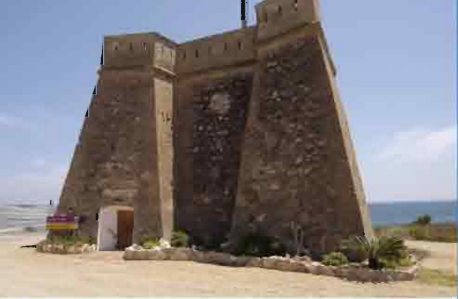
Castillo de Villaricos